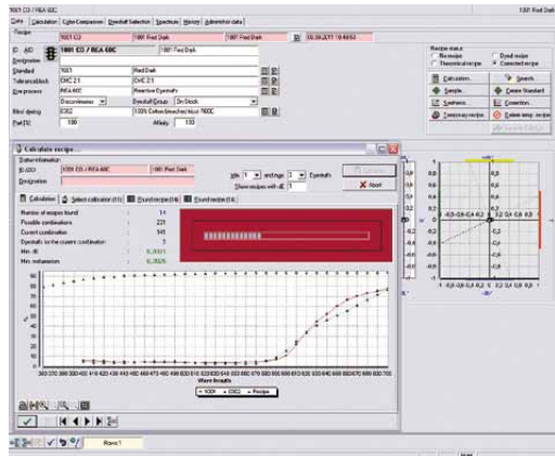
Crear un nuevo trabajo