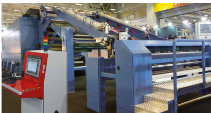
Sedomat 5800+ 安裝在烘乾機