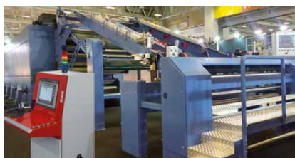
Sedomat 5800+ 安裝在烘乾機